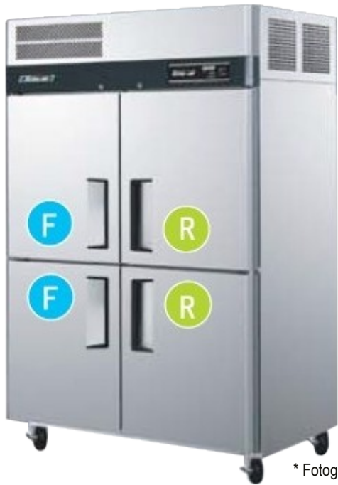
* Fotografía de referencia.